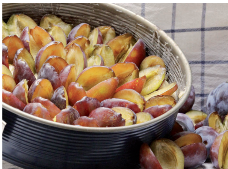
Slivkové koláče sú veľmi obľúbené.

Postup: Sušené slivky zalejeme horúcou vodou a necháme v nej namočené približne 15 minút. Zatiaľ si sušenú šunku rozkrojíme pozdĺžne, každý plátek na dva pásiky. Každú slivku omotáme jedným pásikom sušenej šunky a prepichnete špáradlom. Slivkové závitky pokladíme na plech vystlaný papierom na pečenie a pečieme v rúre vyhriatej na 180 stupňov približne 15 minút.