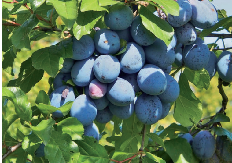
Slivky sú chutné a plné vitamínov.

Slivky pred sušením umyjeme pod tečúcou vodou, následne ich narežeme nožom a vyberieme z nich kôstky. Sušiť ich môžeme v elektrickej rúre tak, že plech vystelieme papierom na pečenie a rovnomerne naň poukladáme pripravené slivky. Jednotlivé kusy by sa