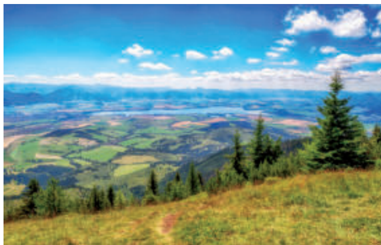
Výhľad z Babiek.

Rovnako ako Babky, aj Sivý vrch (1805 m n.m.) je súčasťou Západných Tatier. Ponúka výhľady na Liptov a Oravu, ktoré rozhodne stoja zato. Dostupný je pritom z oblasti Hút aj z Bobrovca. Túra naň nepatrí medzi najnáročnejšie, no rozhodne je jednou z najkrajších. Túru na Sivý vrch môžete začínať na začiatku Bobroveckej doliny, konkrétne v