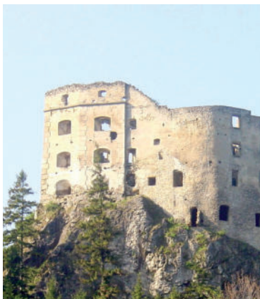
Hrad Likava.

Zrúcaniny Likavského hradu, ktoré stoja na jednom zo skalnatých štítov Chočských vrchov na pravom brehu Váhu, sa nachádzajú približne 25 minút od Liptovského Hrádku.