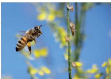
» ren zdroj foto terski pixabay

V takom prípade vždy volajte na tísňovú linku 155 alebo 112. Najrizikovejšie skupiny z hľadiska ohrozenia života po uštipnutí hmyzom sú dojčatá, seniori a alergici.