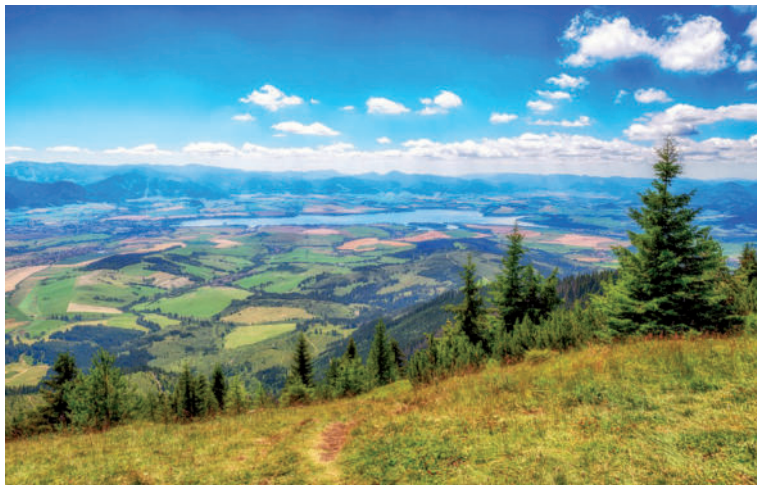
Výhľad z Babiek.

Rovnako ako Babky, aj Sivý vrch (1805 m n.m.) je súčasťou Západných Tatier. Ponúka výhľady na Liptov a Oravu, ktoré rozhodne stoja zato. Dostupný je pritom z oblasti Hút aj z Bobrovca. Túra naň nepatrí medzi najnáročnejšie, no rozhodne je jednou z najkrajších. Túru na Sivý vrch môžete začínať na začiatku Bobroveckej doliny, konkrétne v