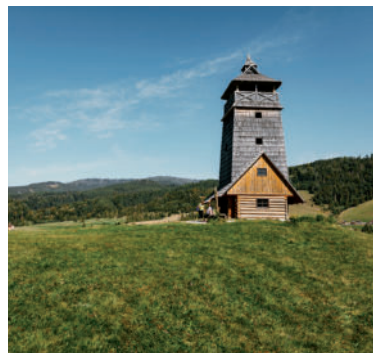
Vyhladková veža Zbojská.

Na území Národného parku Muránska planina nad sedlom Zbojská medzi obcou Pohronská Polhora a mestom Tisovec môžete navštíviť Vyhladkovú vežu Zbojská.