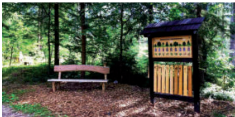
Náučný chodník Tále

Národnú chránenú kultúrnu pamiatku Hrádok (834 m. n. m.), sídlo niekdajších Keltov, tvorí sústava výšinných hradísk, ku ktorému vedie náučný chodník. Východiskovým bodom vašej vychádzky, ktorá bude dlhá približne 3,5 km, môže byť izba „Kelti na Horehroní“, ktorá je situovaná v centre obce Horná Lehota. Odtiaľ sa vydáte po