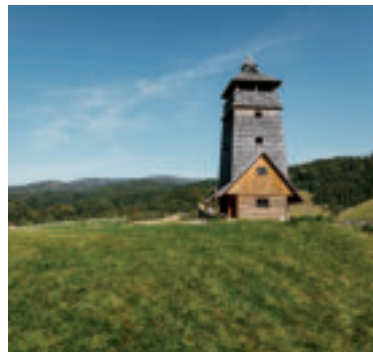
Vyhladková veža Zbojská.

Na území Národného parku Muránska planina nad sedlom Zbojská medzi obcou Pohronská Polhora a mestom Tisovec môžete navštíviť Vyhladkovú vežu Zbojská.