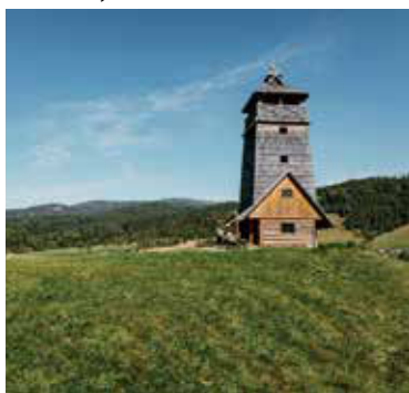
Vyhliadková veža Zbojská.

Na území Národného parku Muránska planina nad sedlom Zbojská medzi obcou Pohronská Polhora a mestom Tisovec môžete navštíviť Vyhliadkovú vežu Zbojská.