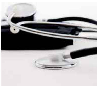
» ren zdroj foto Bru-nO pixabay

Ďalší postup a vhodnú liečbu následne určí lekár na základe výsledkov vyšetrenia a podľa stanovenej diagnózy a celkového zdravotného stavu.