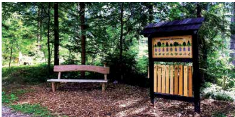
Náučný chodník Tále

Národnú chránenú kultúrnu pamiatku Hrádok (834 m. n. m.), sídlo niekdajších Keltov, tvorí sústava výšinných hradísk, ku ktorému vedie náučný chodník. Východiskovým bodom vašej vychádzky, ktorá bude dlhá približne 3,5 km, môže byť izba „Kelti na Horehroní“, ktorá je situovaná v centre obce Horná Lehota. Odtiaľ sa vydáte po