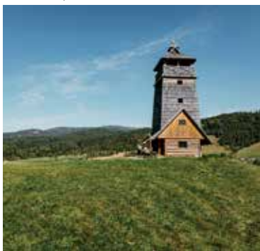
Vyhliadková veža Zbojská.

Na území Národného parku Muránska planina nad sedlom Zbojská medzi obcou Pohronská Polhora a mestom Tisovec môžete navštíviť Vyhliadkovú vežu Zbojská.