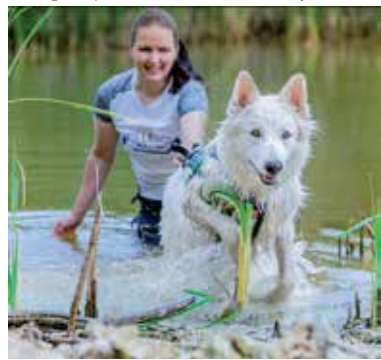
Aponi Dog Race.

Rozsiahly areál štítnického Vodného hradu dodnes odkazuje na niekdajší význam tohto zaujímavého gemerského mestečka. Štítnické hradné hry sú každoročne príjemným spštením leta na Gemeri a ukážu aj to, že za pokladmi európskej histórie netreba nevyhnutne