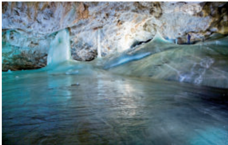
Dobšinská ľadová jaskyňa.

Celkom iná situácia je však v Dobšinskej ľadovej jaskyni. Tá, aj napriek nepriazni klímy, je stále impozantným podzemným „ľadovým kráľovstvom“. Návštevníkov privítajú rozsiahle ľadové plochy Malej a Veľkej siene, pričom druhá kedysi slúžila na letné korčuľovanie. Na konci 19. storočia sa v nej korčuľovalo vtedajšie panstvo, neskôr dokonca krasokorčuľárska a hokejová reprezentácia Československa. „Návštevníci na prehliadkovej trase prekonávajú dva ľadové tunely vyrazené v podzemnom ľadovci a dostanú sa až na jeho úpätie, kde ich zaujme vrstevnatosť podzemného ľadového gigantu. Jaskyňa s objemom ľadu 110 000 m 3 je skutočným svetovým unikátom, o čom svedčí aj jej zapísanie do zoznamu svetového prírodného dedičstva UNESCO v roku 2000. Napriek tomu, že nepriaznivá klimatická situácia ľadu v jaskyni, najmä ľadovým stĺpom zdobiacim Veľkú sieň rozhodne neprospeje, podzemný ľadovec jaskyne nie je ohrozený,“ priblížila ŠOP SR.