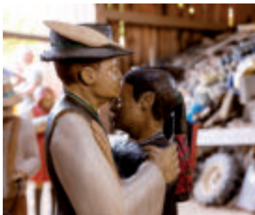
» ren zdroj foto Trnavský samosprávny kraj

Národné české a slovenské múzeum a knižnica, ktoré sa nachádza v americkom štáte Iowa, oslavuje v tomto roku 50. výročie svojho založenia a na jeseň 2025 uplynú tri desaťročia od jeho presťahovania do novej väčšej budovy. Združenie, ktoré si predsavzalo uchovať minulosť svojich predkov, vzniklo v roku 1974 v Cedar Rapids v Iowe. Jeho členmi boli príslušníci druhej a tretej generácie potomkov prisťahovalcov. V roku 1992 Kongres USA oficiálne uznal toto múzeum za národnú kultúrnu inštitúciu Čechov a Slovákov žijúcich v Spojených štátoch.