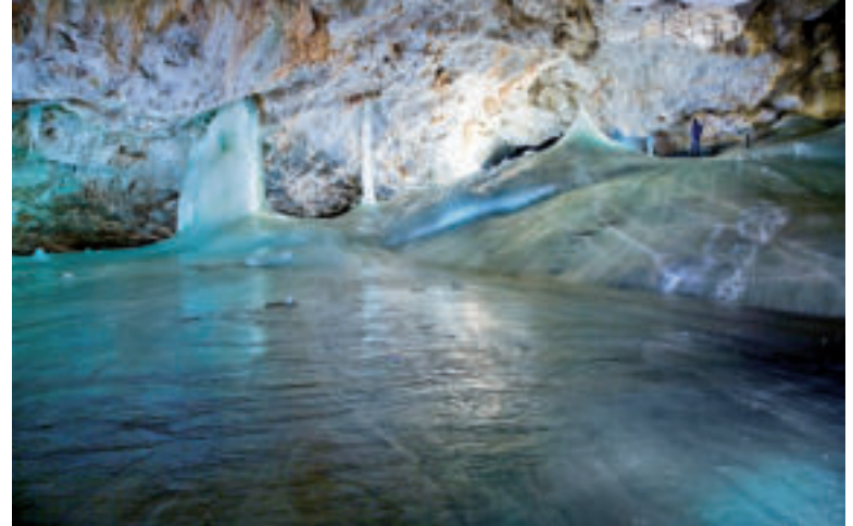
Dobšinská ľadová jaskyňa.

Celkom iná situácia je však v Dobšinskej ľadovej jaskyni. Tá, aj napriek nepriazni klímy, je stále impozantným podzemným „ľadovým kráľovstvom“. Návštevníkov privítajú rozsiahle ľadové plochy Malej a Veľkej siene, pričom druhá kedysi slúžila na letné korčuľovanie. Na konci 19. storočia sa v nej korčuľovalo vtedajšie panstvo, neskôr dokonca krasokorčuľárska a hokejová reprezentácia Československa. „Návštevníci na prehliadkovej trase prekonávajú dva ľadové tunely vyrazené v podzemnom ľadovci a dostanú sa až na jeho úpätie, kde ich zaujme vrstevnatosť podzemného ľadového gigantu. Jaskyňa s objemom ľadu 110 000 m 3 je skutočným svetovým unikátom, o čom svedčí aj jej zapísanie do zoznamu svetového prírodného dedičstva UNESCO v roku 2000. Napriek tomu, že nepriaznivá klimatická situácia ľadu v jaskyni, najmä ľadovým stĺpom zdobiacim Veľkú sieň rozhodne neprospeje, podzemný ľadovec jaskyne nie je ohrozený,“ priblížila ŠOP SR.