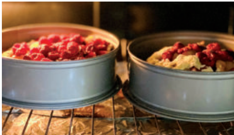
Ilustračné foto. zdroj foto ThreeMilesPerHour pixabay

Postup: Ríbezle umyjeme a necháme na site odkvapkať. Do misky rozbijeme vajcia a spolu s cukrom a vlažnou vodou ich vymiešame do peny. Potom zľahka po častiach vmiešame múku zmiešanú s vanilkovým cukrom. Plech vystelieme papierom na pečenie, vylejeme cesto a poukladáme husto ríbezle. Bublaninu pečieme približne 30 až 40 minút pri teplote 180°C, podľa druhu rúry a veľkosti formy.