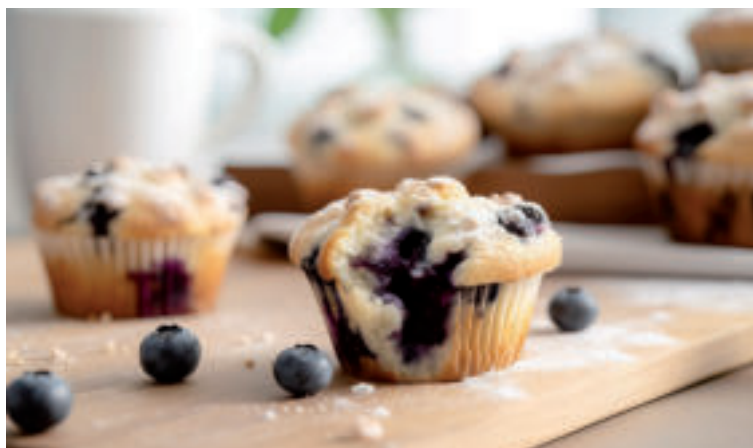
Ilustračné foto.

Prípravíme si plech na pečenie mafinov a jeho otvory vyložíme košíčkami alebo papierom na pečenie, ktorý sme