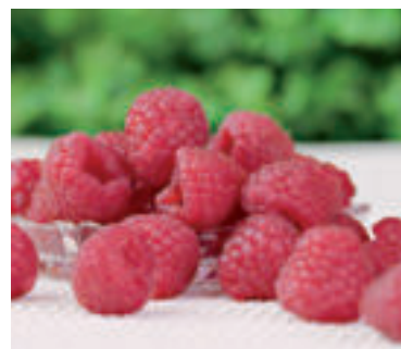
Ilustračné foto.

Maliny obsahujú vitamíny C a A, ako aj minerály a stopové prvky: meď, draslík, železo, horčík, vápnik, zinok, kobalt. Podporujú zdravý zrak, chránia bunky, ovplyvňujú kvalitu zubov, kostí, vlasov a pokožky. Používajú sa aj pri prechladnutí a akútnych ochoreniach dýchacích ciest, pri chrípke, horúčkovitých stavoch, bolestiach kĺbov a neuralgii. Pomáhajú aj pri problémoch s trávením.