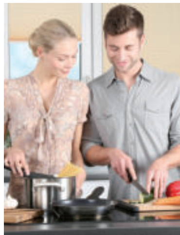
Ilustračné foto.

Používajte zdravotne bezpečnú vodu. Vyberajte si čerstvé a zdravé potraviny a tie, ktoré boli vyrobené bezpečnými postupmi, ako je napríklad pasterizované mlieko. Umývajte ovocie a zeleninu pitnou vodou, týka sa to napríklad aj šupy melóna (pri porciovaní neumytého melóna si môžete nechtiac preniesť mikroorganizmy zo šupy melóna priamo na jeho jedlú časť).