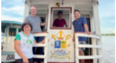
» acn zdroj foto ACN