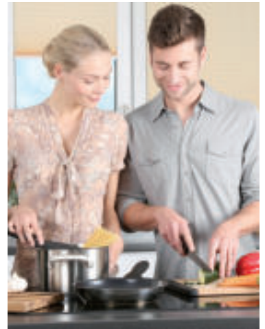
Ilustračné foto.

Používajte zdravotne bezpečnú vodu. Vyberajte si čerstvé a zdravé potraviny a tie, ktoré boli vyrobené bezpečnými postupmi, ako je napríklad pasterizované mlieko. Umývajte ovocie a zeleninu pitnou vodou, týka sa to napríklad aj šupy melóna (pri porciovaní neumytého melóna si môžete nechtiac preniesť mikroorganizmy zo šupy melóna priamo na jeho jedlú časť).