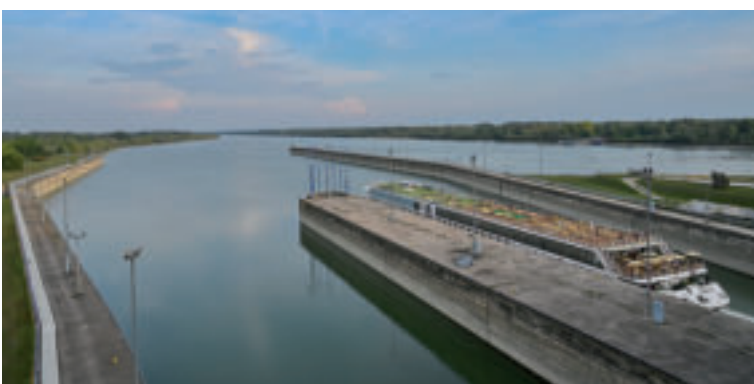
Vodné dielo Gabčíkovo.

Prvou tohtoročnou novinkou je celodenný výlet na Žitný ostrov, ktorý zahŕňa exkurziu na Vodnom diele Gabčíkovo a popoludnie plné zábavy v akvaparku. Dostal názov TurboVýlet odkazujúci na možnosť spoznať fungovanie obrovských vodných turbín zblízka. Získavanie vedomostí o jednom z najväčších vodohospodárskych projektov v Európe je doplnené o oddych na obľúbenom kúpalisku s termálnou vodou, ktoré je plné atrakcií pre deti a wellness možnosti pre dospelých. „Individuálne prehliadky najväčšieho vodného diela na Dunaji nie sú verejnosti bežne dostupné. Vodohospodárska výstavba ich však ponúka organizovaným skupinám, preto sme sa rozhodli vypraviť autobus s nástupnými miestami v Piešťanoch, Trnave a Galante. Pre turistov, ktorí sa chcú dozvedieť ako táto viacúčelová monumentálna stavba funguje, je to jedinečná príležitosť. Bezstarostný výlet si užijú rodiny s deťmi, partie kamarátov a všetci, ktorí sa zaujímajú o techno-