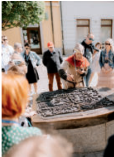
Začínajú sa bezplatné prehliadky Trnavy.

Celý program potrvá približne 60 minút a je vhodný pre deti aj anglicky hovoriacich návštevníkov. Zaujímavosťou môžu absolvovať dva tematické