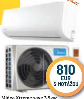
Midea Xtreme save 3,5kw