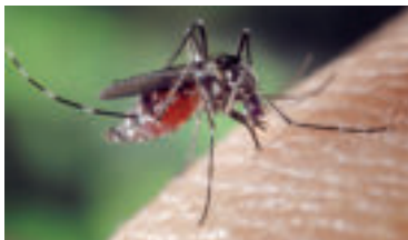
» ren zdroj foto FotoshopTofs pixabay