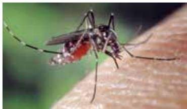
» ren zdroj foto FotoshopTofs pixabay