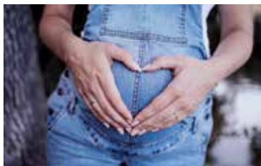
» ren zdroj foto Robster_91 pixabay

Viac informácií o dávke tehotenskej nájdete na webovej stránke Sociálnej poisťovne.