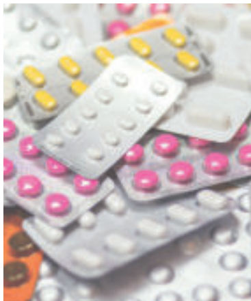
» ren zdroj foto pexels pixabay

Zvýšená citlivosť pokožky na slnko môže podľa nich negatívne ovplyvniť aj dlhodobé kožné ochorenia ako napríklad atopickú dermatitídu, psoriázu alebo herpes,“ objasňujú a dodávajú: „Pri užívaní takýchto liekov sa odporúča obmedziť pobyt na slnku v čo najväčšej možnej miere. Rovnako je dôležité používanie slnečnej ochrany počas celého dňa a to aj v prípade pobytu mimo priameho slnka“.