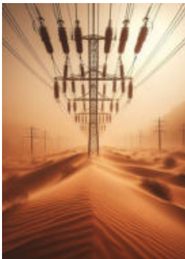
Armatúry ML Produktion odolávajú extrémnym podmienkam v mrazoch aj na púšti Ilustračné foto

Extrémne horúčavy aj treskúce mrazy. Unikátne výrobky z dvoch slovenských závodov denne zvädzajú boj s prírodnými živlami. Sú súčasťou dôležitej misie – prinesť ľuďom elektrickú energiu aj do ťažko dostupných oblastí.