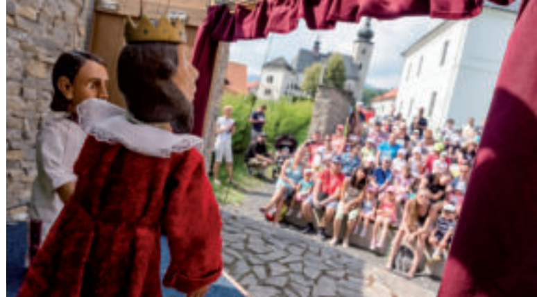
Na Liptove chystajú pestrú zábavu pre rodiny s deťmi.

Návštevníci sa budú môcť opäť tešiť na množstvo novinek a vylepšení. K väčšej LED obrazovke pribudne prehladnejšie značenie, priestrannejšia oddychová a gastro zóna a ťahákom pre deti bude určite aj zábavný park s množstvom atraktívnych nafukovacích hradov. Na festivale zároveň zažije premiéru aj novučičká rozprávka O zbudlivej víle z knihy ZA 7 HORAMI v podaní Bábkového divadla UŽ. Programovými ťahákmi budú víkendové koncerty skupiny Basawell, vystúpenia obľúbeného