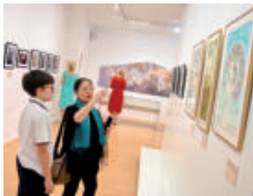
Výstava diel Alfonsa Muchu...

Piešťanské kúpele sa v roku 2023 stali prvým miestom mimo územia Českej republiky, ktoré sa pripojilo k projektu Muchova cesta. Tento rok predstavuje Nadácia Mucha svetoznámeho umelca ako geniálneho fotografa. Šesťdielna výstava približne 120 fotografických diel Alfonsa Muchu, ale aj ikonických plagátov, kresieb, štúdií, osobných predmetov, sôch a obrazov z rodinnej zbierky bude prístupná na piatich miestach v Českej republike a jednom na Slovensku, tým sú Piešťany. „Ako ukázala predchádzajúca séria výstav Nadčasový Mucha: Prepojenie sveta (2022) a Alfons Mucha: Kvetinové svety (2023), Mucha bol popredným predstaviteľom secesie,