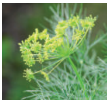
» ren zdroj foto Kathas_Fotos pixabay