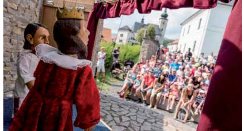
Na Liptove chystajú pestrú zábavu pre rodiny s deťmi.

Návštevníci sa budú môcť opäť tešiť na množstvo noviniek a vylepšení. K väčšej LED obrazovke pribudne prehľadnejšie značenie, priestrannejšia oddychová a gastro zóna a ťahákom pre deti bude určite aj zábavný park s množstvom atraktívnych nafukovacích hradov. Na festivale zároveň zažije premiéru aj novučičká rozprávka O zábudlivej víle z knihy ZA 7 HORAMI v podaní Bábkového divadla UŽ. Programovými ťahákmi budú víkendové koncerty skupiny Basawell, vystúpenia obľúbeného