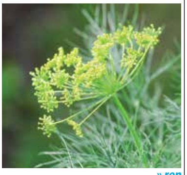
» ren zdroj foto Kathas_Fotos pixabay