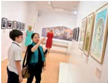
Výstava diel Alfonsa Muchu...

Piešťanské kúpele sa v roku 2023 stali prvým miestom mimo územia Českej republiky, ktoré sa pripojilo k projektu Muchova cesta. Tento rok predstavuje Nadácia Mucha svetoznámeho umelca ako geniálneho fotografa. Šesťdielna výstava približne 120 fotografických diel Alfonsa Muchu, ale aj ikonických plagátov, kresieb, štúdií, osobných predmetov, sôch a obrazov z rodinnej zbierky bude prístupná na piatich miestach v Českej republike a jednom na Slovensku, tým sú Piešťany. „Ako ukázala predchádzajúca séria výstav Nadčasový Mucha: Prepojenie sveta (2022) a Alfons Mucha: Kvetinové svety (2023), Mucha bol popredným predstaviteľom secesie,