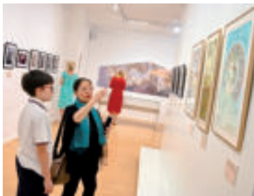
Výstava diel Alfonsa Muchu...

Piešťanské kúpele sa v roku 2023 stali prvým miestom mimo územia Českej republiky, ktoré sa pripojilo k projektu Muchova cesta. Tento rok predstavuje Nadácia Mucha svetoznámeho umelca ako geniálneho fotografa. Šesťdielna výstava približne 120 fotografických diel Alfonsa Muchu, ale aj ikonických plagátov, kresieb, štúdií, osobných predmetov, sôch a obrazov z rodinnej zbierky bude prístupná na piatich miestach v Českej republike a jednom na Slovensku, tým sú Piešťany. „Ako ukázala predchádzajúca séria výstav Nadčasový Mucha: Prepojenie sveta (2022) a Alfons Mucha: Kvetinové svety (2023), Mucha bol popredným predstaviteľom secesie,