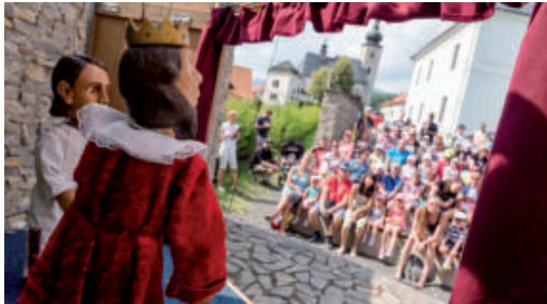
Na Liptove chystajú pestrú zábavu pre rodiny s deťmi.

Návštevníci sa budú môcť opäť tešiť na množstvo noviniek a vylepšení. K väčšej LED obrazovke pribudne prehladnejšie značenie, priestrannejšia oddychová a gastro zóna a ťahákom pre deti bude určite aj zábavný park s množstvom atraktívnych nafukovacích hradov. Na festivale zároveň zažije premiéru aj novučičká rozprávka O zbudlivej víle z knihy ZA 7 HORAMI v podaní Bábkového divadla UŽ. Programovými ťahákmi budú víkendové koncerty skupiny Basawell, vystúpenia obľúbeného