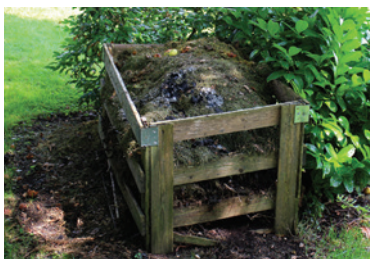
» ren Ilustračné foto.

Náš tip: Ak začne kompost zapáchať pridajte doň hnedý odpad. Ak sa vám bude javiť príliš suchý, pridajte zelený odpad a trochu vody.