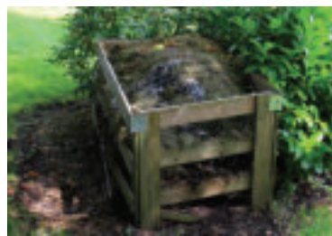
» ren Ilustračné foto.

Náš tip: Ak začne kompost zapáchať pridajte doň hnedý odpad. Ak sa vám bude javiť príliš suchý, pridajte zelený odpad a trochu vody.