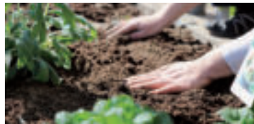
» ren Ilustračné foto, zdroj foto planet_fox pixabay

Plot záhrady môžete zasa využiť pri pestovaní tých druhov zeleniny, ktoré sa ťahajú do výšky. Rastliny tak získajú prirodzenú oporu, ktorú môžete ešte vylepšiť pletivom či drevenými doštičkami, ktoré na stenu či plot pripevníte a k nim môžete v niektorých miestach rastliny postupne počas rastu priväzovať. Takto môžete pestovať uhorky, cukety, fazuľku aj niektoré druhy rajčiakov. Pod nimi tak získate priestor pre iné plodiny.