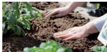
» ren Ilustračné foto.

Plot záhrady môžete zasa využiť pri pestovaní tých druhov zeleniny, ktoré sa fahajú do výšky. Rastliny tak získajú prirodzenú oporu, ktorú môžete ešte vylepšiť pletivom či drevenými doštičkami, ktoré na stenu či plot pripevníte a k nim môžete v niektorých miestach rastliny postupne počas rastu priväzovať. Takto môžete pestovať uhorky, cukety, fazuľku aj niektoré druhy rajčiakov. Pod nimi tak získate priestor pre iné plodiny.