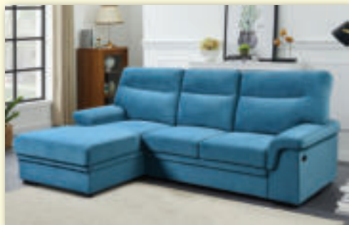
Sedacia súprava ERIKA rozkladacia s úložným priestorom spanie 135 cm x 193 cm pôvodná cena 780 € / AKCIA 699 €