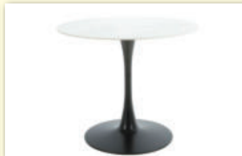
Stôl GDT 36 s originálnym keramickým platom priemer 90 cm pôvodná cena 123 € / AKCIA 99 €