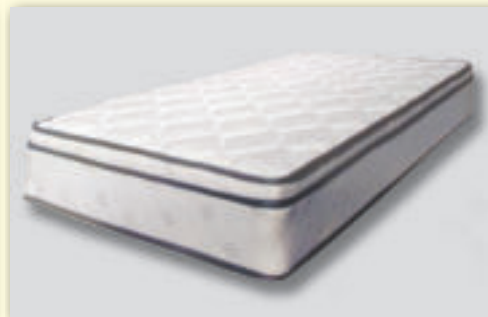
Ortopedický matrac CC3 - výška 27 cm šírka: 200 x 80 x 27 - pôvodná cena 275 € / AKCIA 99 € šírka: 200 x 90 x 27 - pôvodná cena 290 € / AKCIA 113 € šírka: 200 x 160 x 27 - pôvodná cena 450 € / AKCIA 199 € šírka: 200 x 180 x 27 - pôvodná cena 515 € / AKCIA 230 €

ZÁCLONY - 50% až 70 % | KOBERCE - 30% až 50 % | LUSTRE - 50%