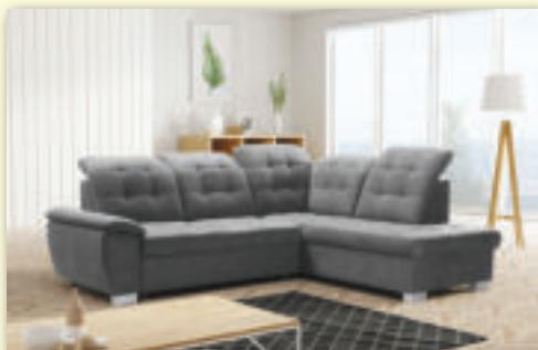
Sedacia súprava LOTTA rohová, rozkladacia s úložným priestorom rozmery: 258 x 212 x 86/102, rozmery spanie: 186 x 125 pôvodná cena 1 076 € / AKCIA 890 €