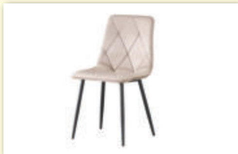
Stolička LDC 986 pôvodná cena 39 € / AKCIA 33 €