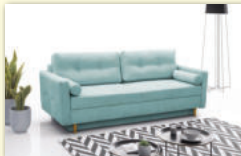
Pohovka PASTELA rozkladacia s úložným priestorom spanie 190 cm x 155 cm pôvodná cena 594 € / AKCIA 499 €