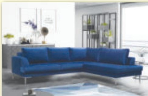
Sedacia súprava LOGAN rozmery: š. 255 cm x v. 85 cm x hl. 205 cm pôvodná cena 951 € / AKCIA 699 €