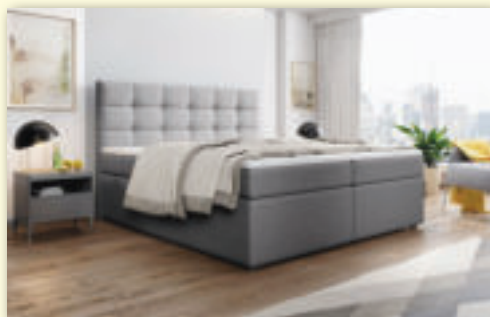
Vysoké postele rôzne šírky 140cm, 160 cm, 180 cm a 200 cm pôvodná cena od 610 €

Tovar máme skladoom. Akcia trvá do vypredania zásob.