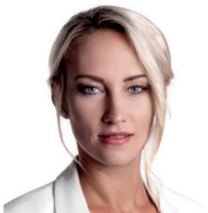
Poslankyňa NR SR za hnutie Sme rodina Petra Hajšelová