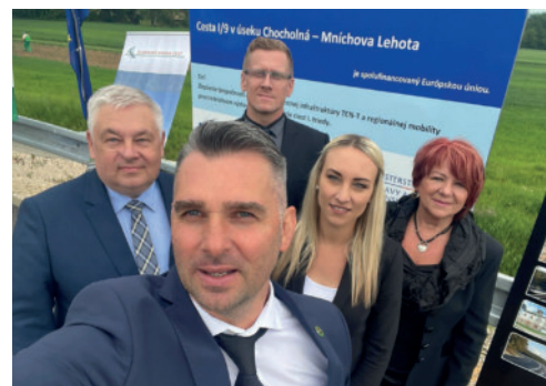
Objednávateľ: Sme rodina, Lešková 5, 811 04 Bratislava, IČO: 42254515 Dodávateľ: REGIONPRESS, s.r.o., Pekárska 7489/40A 917 01 Trnava, IČO: 36 252 417